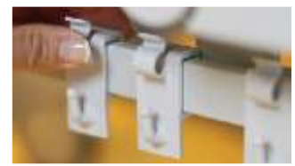
Двусторонние держатели для принадлежностей