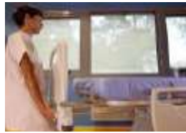
Возможность удлинить кровать для высоких пациентов