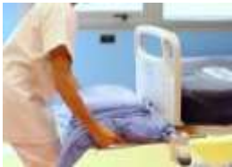
Выдвижная полка для белья