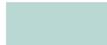
GREEN / VERDE